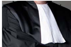
Archief - Rechter in Den Haag moet weg van hof

Dat heeft het Openbaar Ministerie gisteren bekendgemaakt. Tegen de rechter is in oktober aangifte gedaan van het plegen van meined in de nasleep van de zogenoemde Chipshol-zaak.