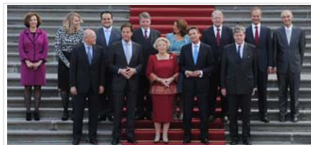
Team-Rutte: bewindslieden op een rij