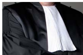
Archief - Rechter in Den Haag moet weg van hof

Dat heeft het Openbaar Ministerie gisteren bekendgemaakt. Tegen de rechter is in oktober aangifte gedaan van het plegen van meined in de nasleep van de zogenoemde Chipshol-zaak.