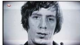
Foto van Koos H. uit de tijd dat hij zijn misdaden pleegde.

Hoewel de Vries de beelden van het met de verborgen camera opgenomen gesprek van H. met zijn jeugdvriend Nico niet uitzond, werd de inhoud van de gesprekken wel onthuld.